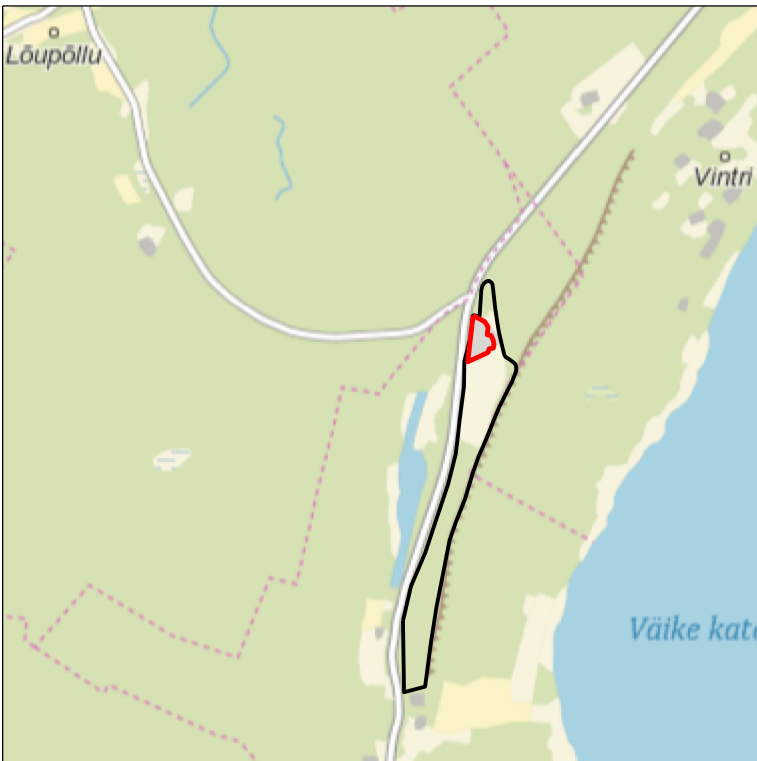
Kaardileht nr 5124 Salme